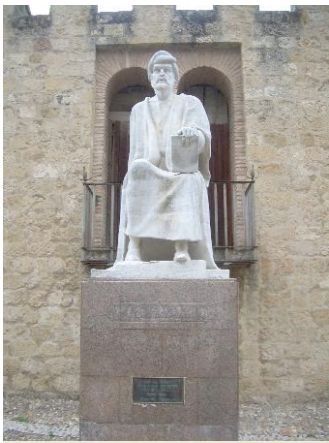
Averroès (1126 -1198)