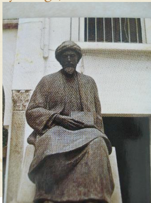
et Maïmonide (1138 -1204)

Comment et dans quels contextes historique et culturel se développent les réflexions philosophiques et théologiques de ces deux intellectuels ? Quels rapports entretiennent juifs et musulmans au Moyen-Age, et quel héritage en gardons-nous ?